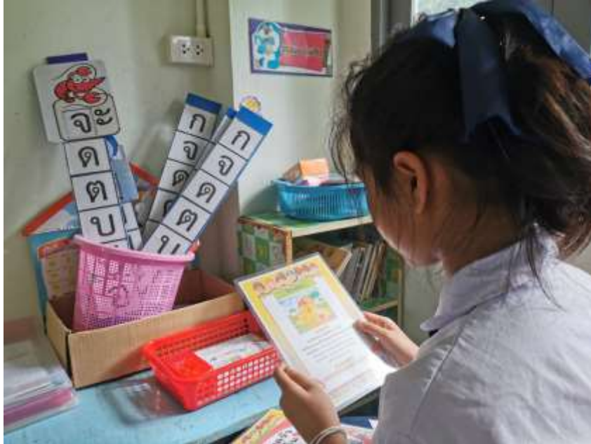
การจัดกิจกรรมโครงการ พัฒนาทักษะการอ่านภาษาไทย “เล่นปนอ่าน พัฒนาการก้าวไกล” ด้วยสื่อและนวัตกรรมทางการศึกษา