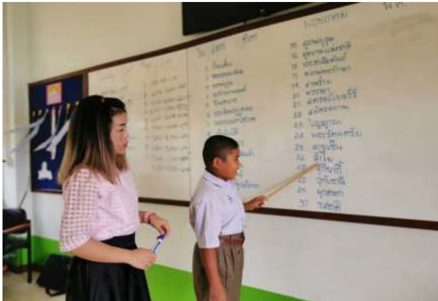
การจัดกิจกรรมโครงการ พัฒนาทักษะการอ่านภาษาไทย “เล่นปนอ่าน พัฒนาการก้าวไกล” ด้วยสื่อและนวัตกรรมทางการศึกษา